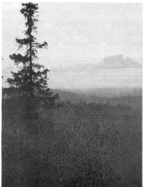
Соловки. Вид с Голгофской горы