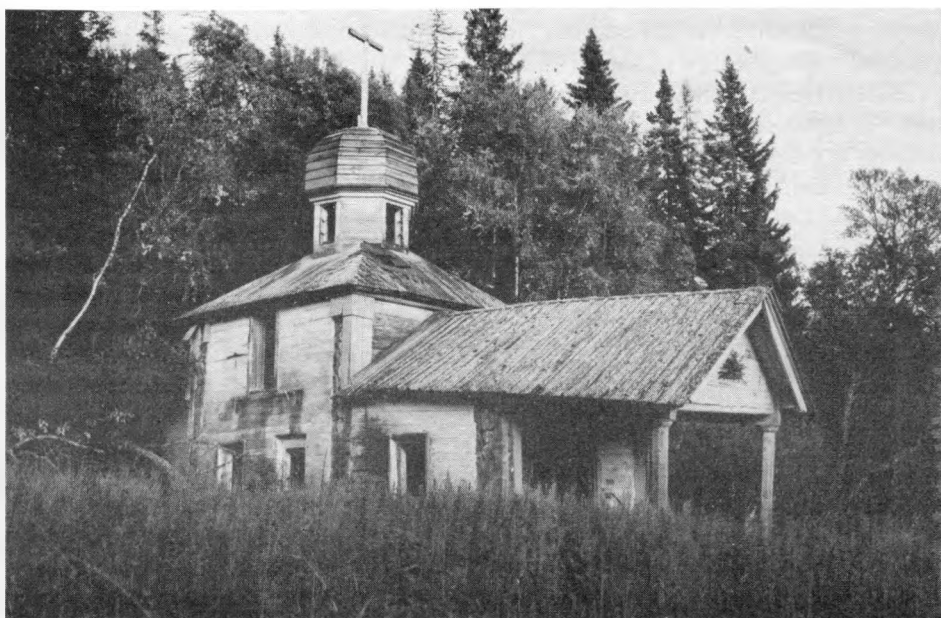
Церковь Воскресения Христова на острове Анзер, у подножия горы Голгофы, места убиения тысяч Новомучеников Российских