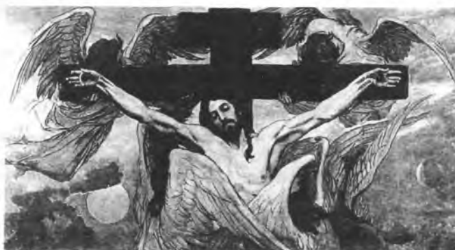
Распятие Господа нашего Иисуса Христа. Эскиз В. Васнецова для росписи плафона для главного нефа Владимирского собора в Киеве.