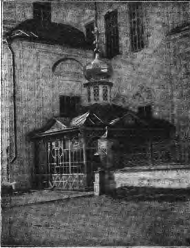
Часовня надъ могилой о. Серафима.