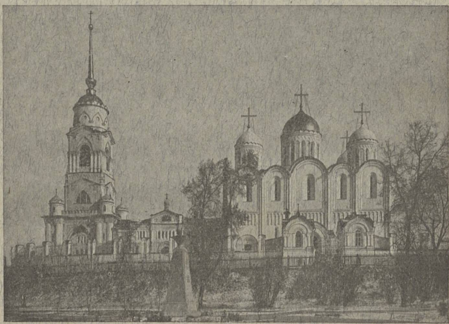
Губ. г. Владиміръ. СКОРОПЕЧАТНЯ И. КОИЛЬ.