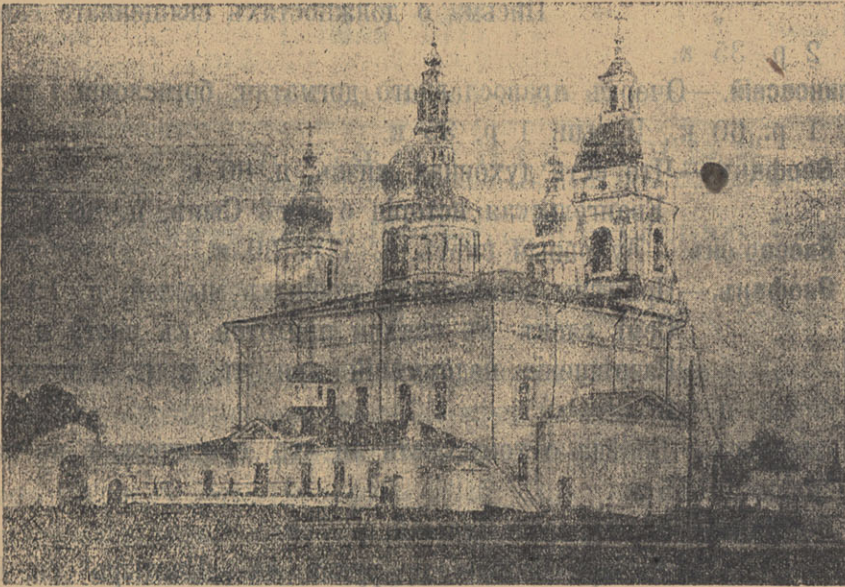
Тобольскій Софійско-Успенскій кафедральный соборъ.

ИЗДАВАЕМЫЯ БРАТСТВОМЪ СВ. ВЕЛИКОМУЧ. ДИМИТРІЯ СОЛУНСКАГО.