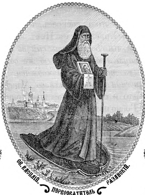
СВ. ВАСИЛ. ПЕРВОВЪДЪВЪЛЪ РЯЗАНСКІИ.

Редакціи просить духовенство и учителей присы- лать статьи по всѣмъ вопро- самъ программы,