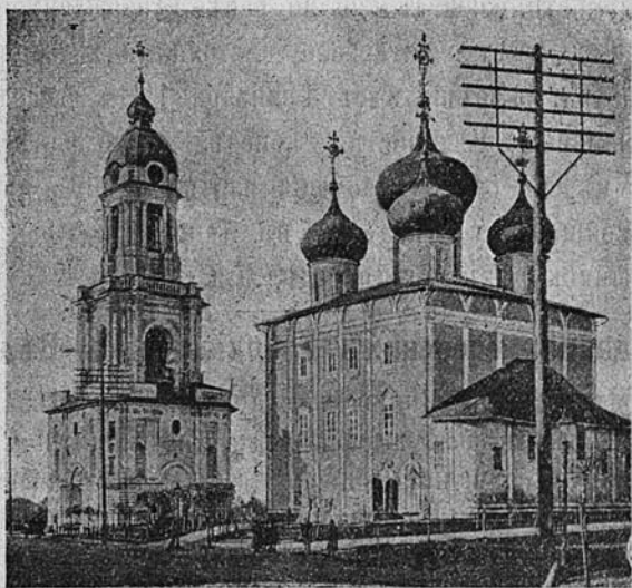
Тверской кафедральный соборъ.