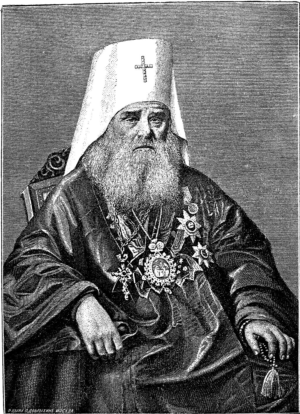
ИННОКЕНТІЙ МИТРОПОЛИТЪ МОСКОВСКІЙ И КОЛОМЕНСКІЙ, первый Предсѣдатель Православнаго Миссіонерскаго Общества [1870—1879 гг.].