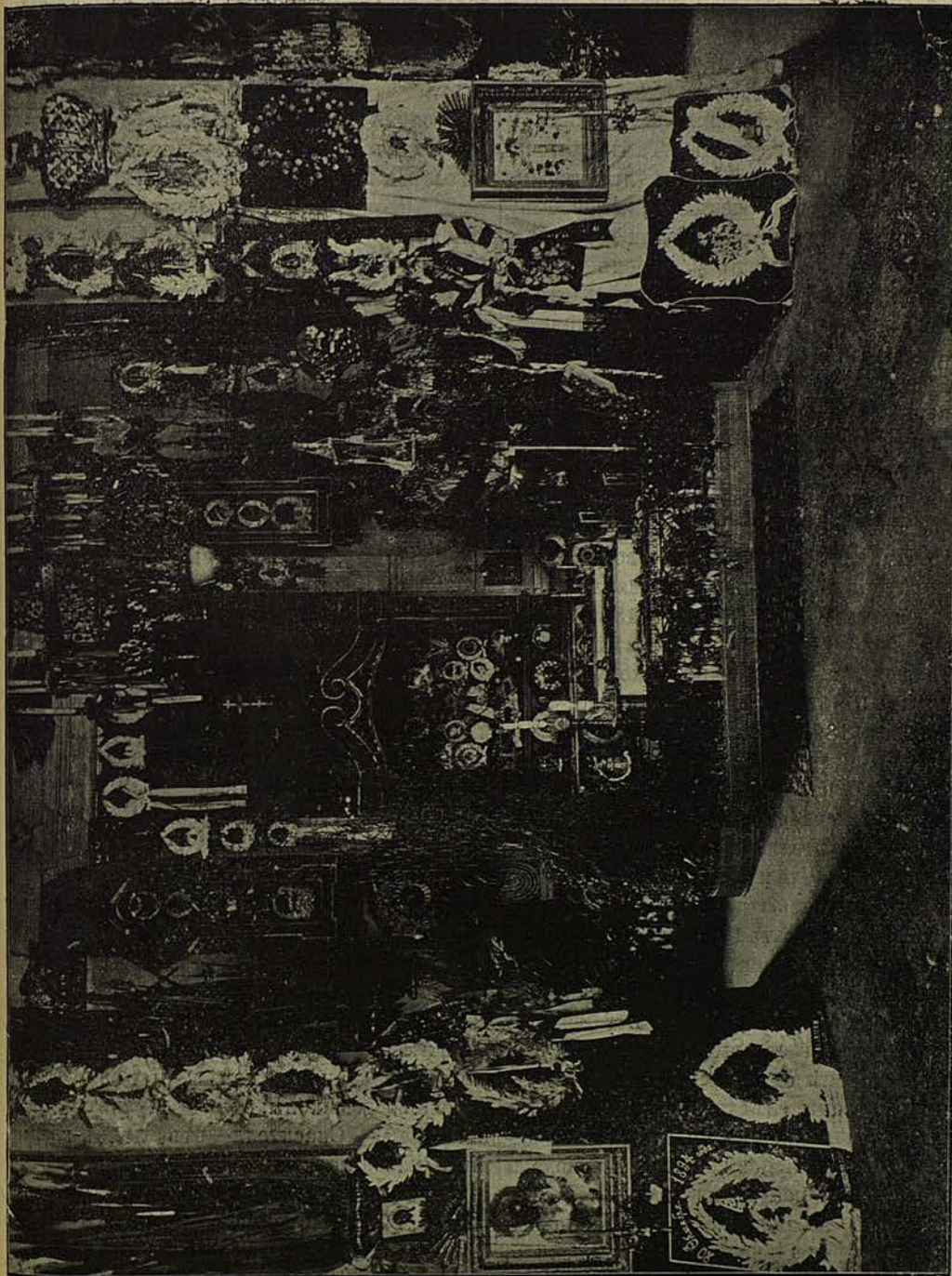
Гробница Императора Александра III.