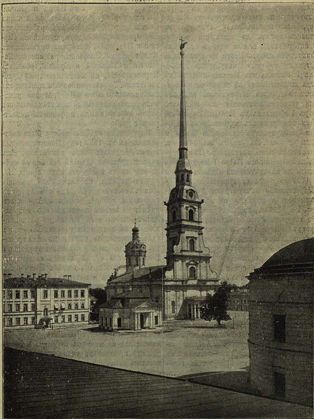
Петропавловскій соборъ въ С.-Петербургѣ.