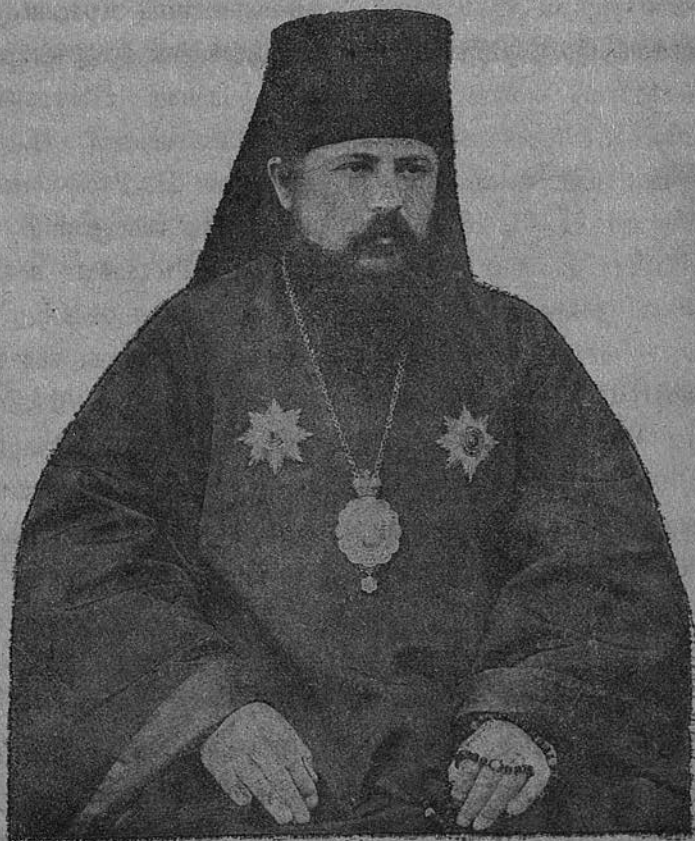
ПРЕОСВЯЩЕННѢЙШІЙ АГАПИТЬ, Епископъ Екатеринославскій и Мариупольскій. 1911—1916 г.