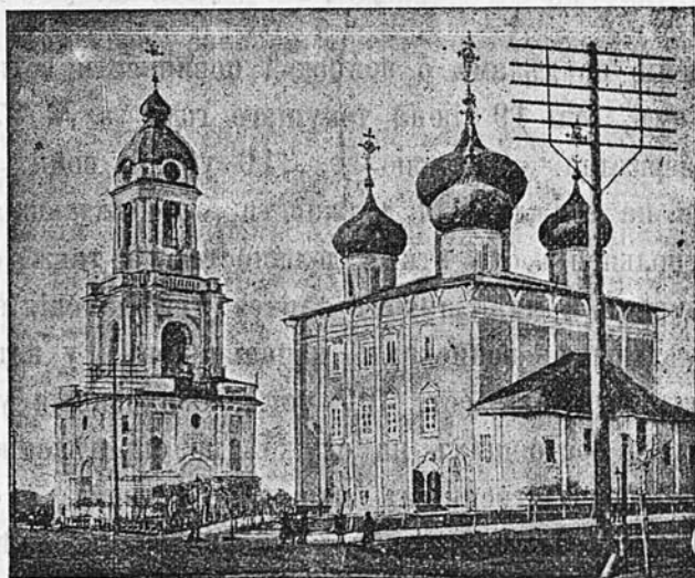
Тверской кафедральный соборъ.