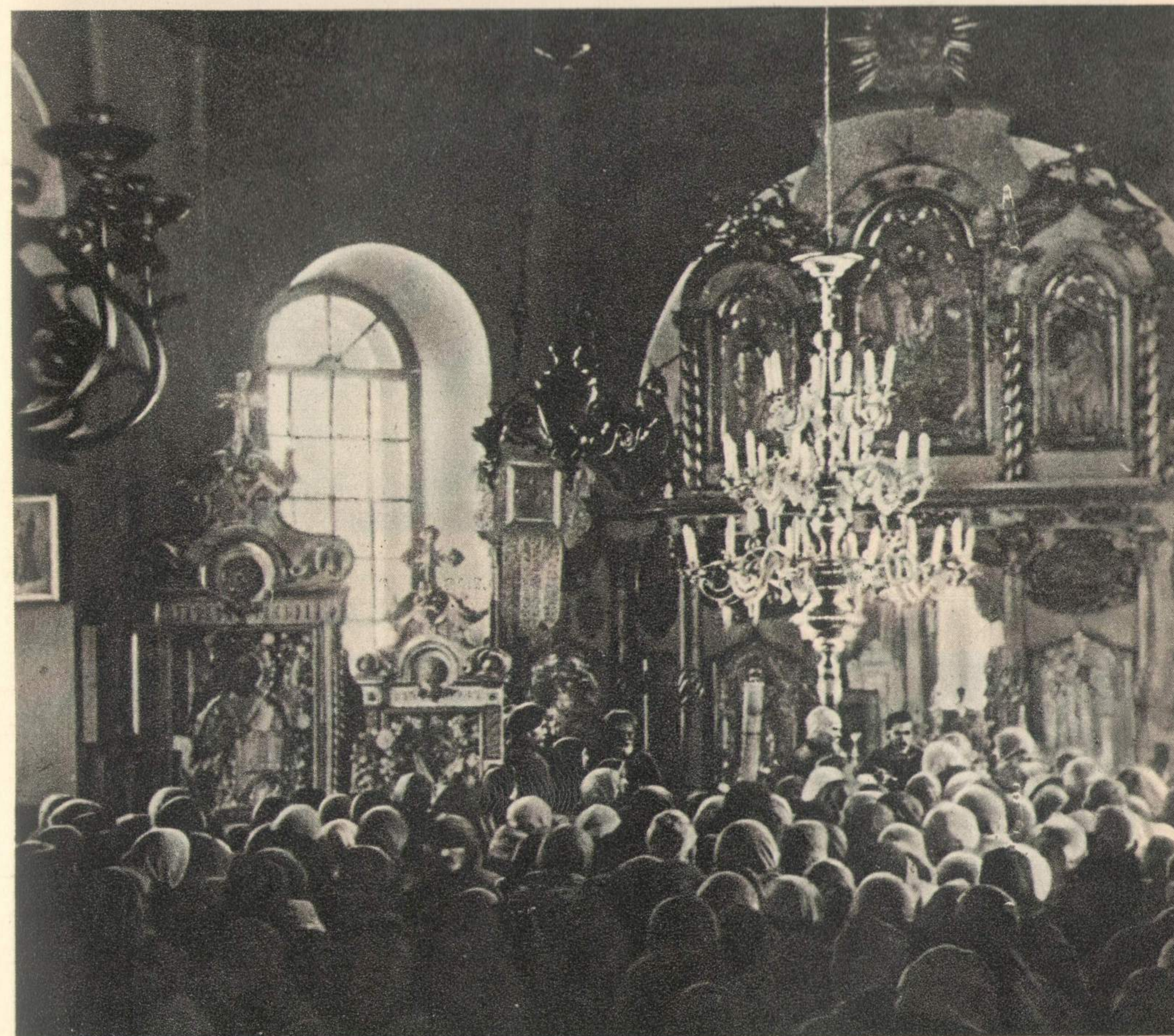
В Иоанно-Предтеченской церкви г. Свердловска во время причащения верующих Великим постом 1942 года

Нас, пастырей, еще более воодушевляет последнее распоряжение Вашего Блаженства о прочтении текста телеграммы из