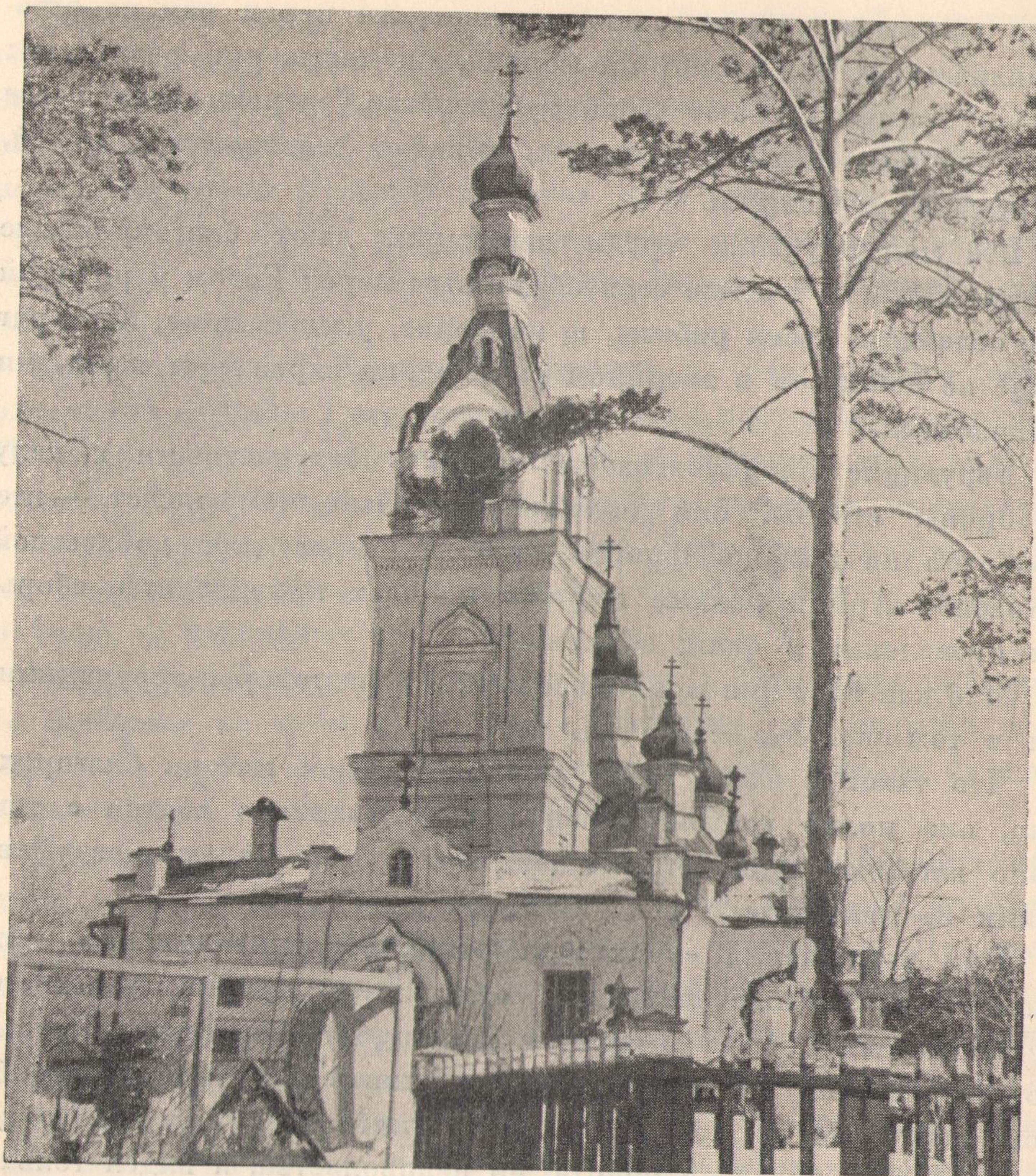
Иоанно-Предтеченская кладбищенская церковь в г. Свердловске

«Молчаливость пастыря — измена родине», — эти золотые слова Вашего Блаженства каждый должен знать. Всякая измена своему отечеству карается на земле людьми и в будущем карается Богом.