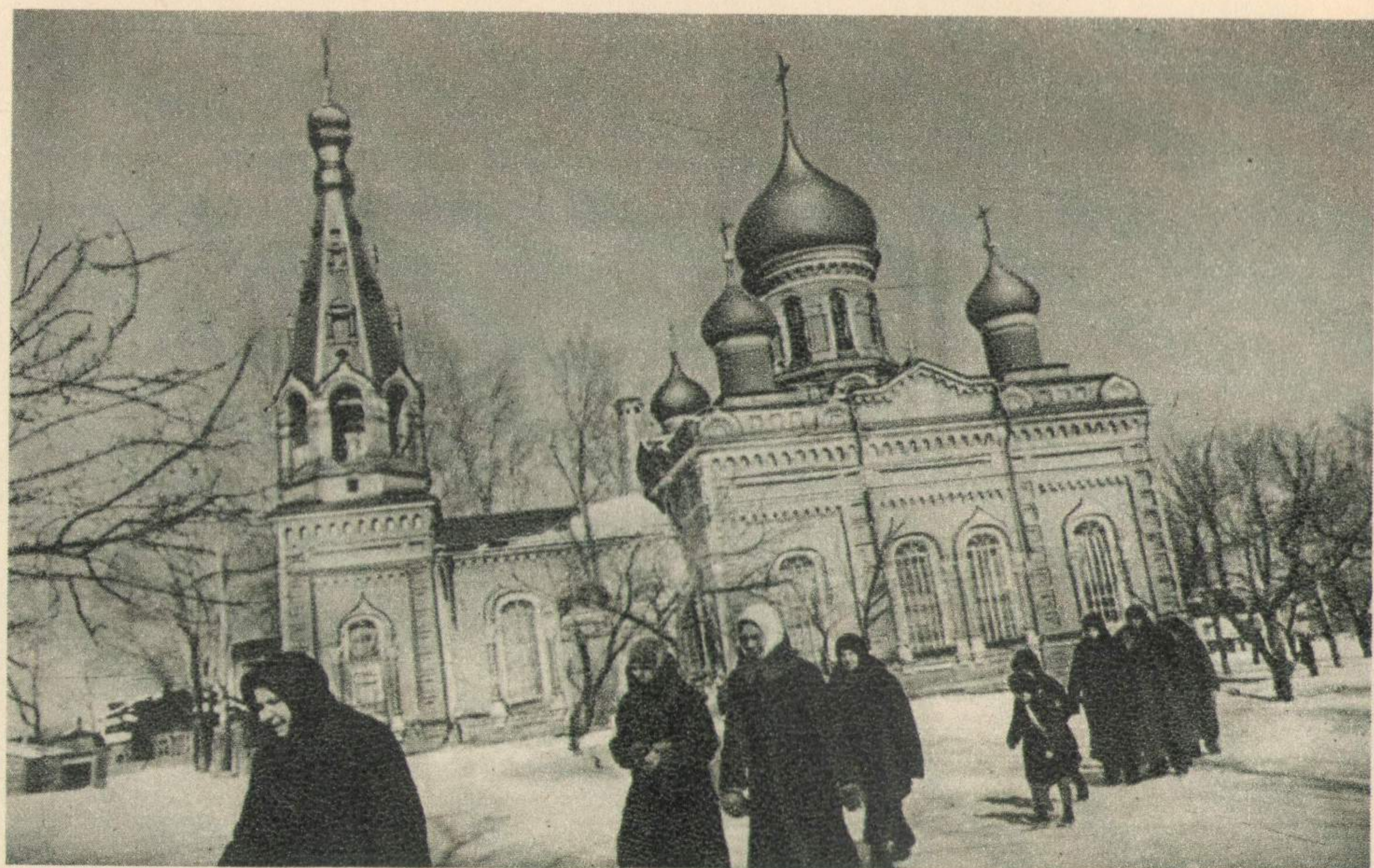
Церковь Двенадцати Апостолов в г. Туле