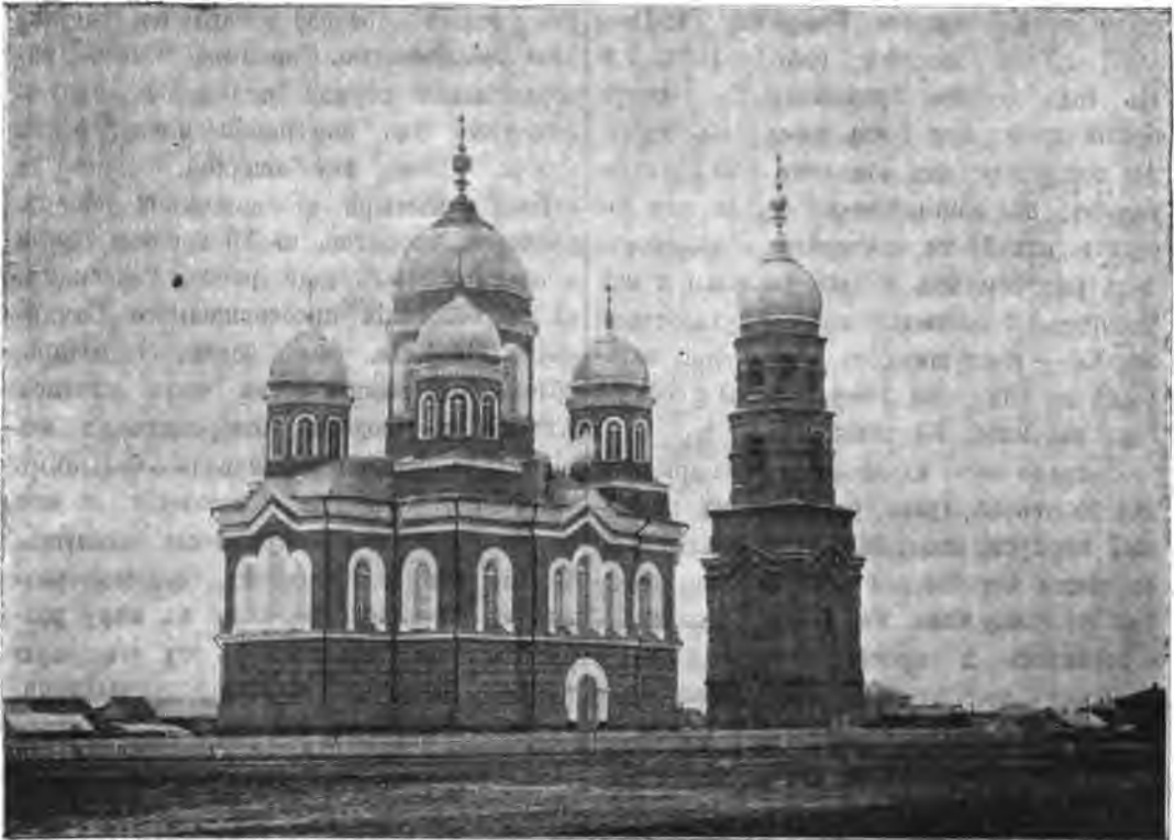
Видъ съ сѣверо-восточной стороны вновь освященнаго Воскресенскаго собора въ гор. Николаевскѣ.

двухъэтажное зданіе церкви со небольшою въ сосѣднѣмъ со Спасо - Преображенскимъ мужскимъ единовѣрческимъ монастыремъ—селѣ Преображенскомъ (деревнѣ Пузанихѣ тожѣ). Зданіе это сооружено иждивеніемъ монастыря въ деревнѣ, заселенной нѣкогда самыми закоренѣлыми раскольниками. Въ виду важнаго просвѣтительнаго значенія монастыря, счита-