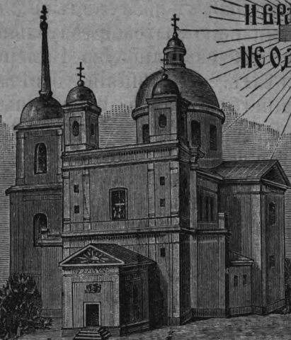
ХР. СВ. ДУХА.

СОЗНИЖДАЮ ЦЕРКОВЬ МОЮ И ВРАТА АДА НЕ ОДОЛЖЮТЬ СЯ