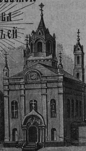
ХР. СВ. ТРОИЦЫ.