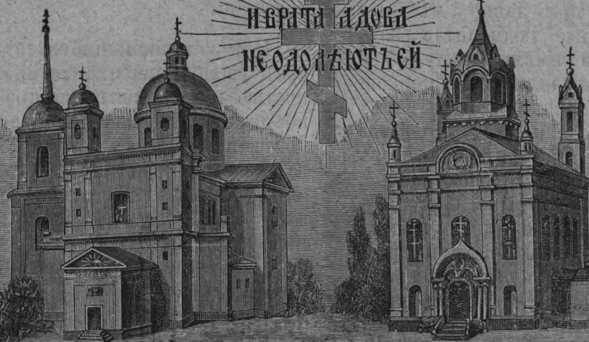
ХР. СВ. ДУХА.

СОЗНАЮТЪ ЦЕРКОВЬ МОЮ И ВРАТА АДА НЕ ОДОЛЖУТЬСЯ