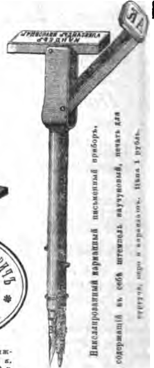
Никелированный карманный письменный приборъ, содержащій въ себѣ штемпель каучуковый, печать для сургуча, перо и карандашъ. Цѣна 1 рубль.