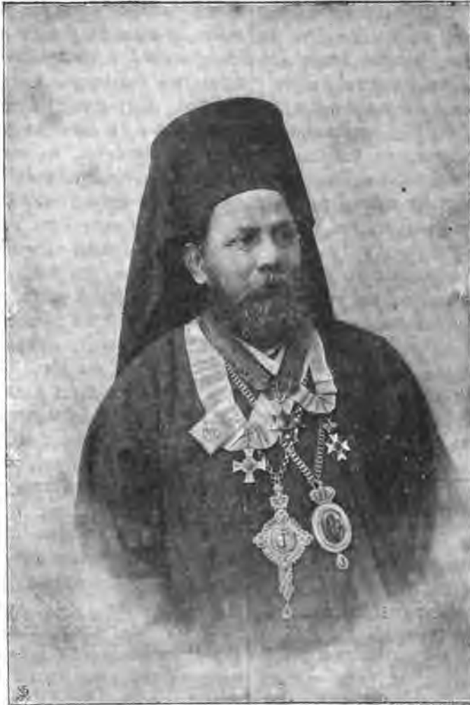
Высокопреосвященный Фотій, архіепископъ Назаретскій.

ныхъ, а также и представители всѣхъ вѣрсповѣданій. При этомъ были прочитаны приличествующія случаю рѣчи и стихотворенія на арабскомъ и греческомъ языкахъ. Кромѣ греческаго языка, новый