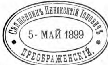
Ручной календарь съ передвѣжными каучук. колес. 3 р. 50 к. Такой-же металлическій. 8 р. 50 к.