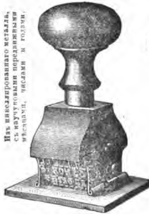
Изъ никелированного жестила, съ каучуковыми передвѣжными вѣстками, тислами и голцами.

Штемпель каучуковый . . . . . 2 руб. Такой-же металлическій . . . . . 8 руб.