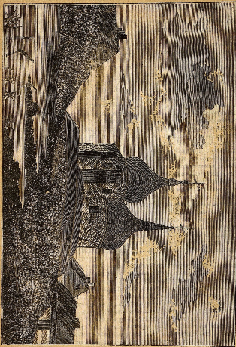
Церковь святаго священномученика Кузми.