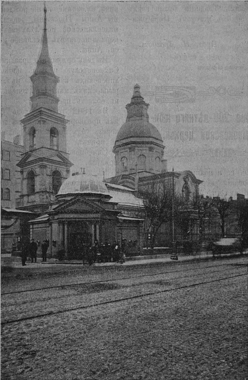
Церковь во имя св. Симеона Богопріимца и Анны Пророчицы на Симоновской ул.