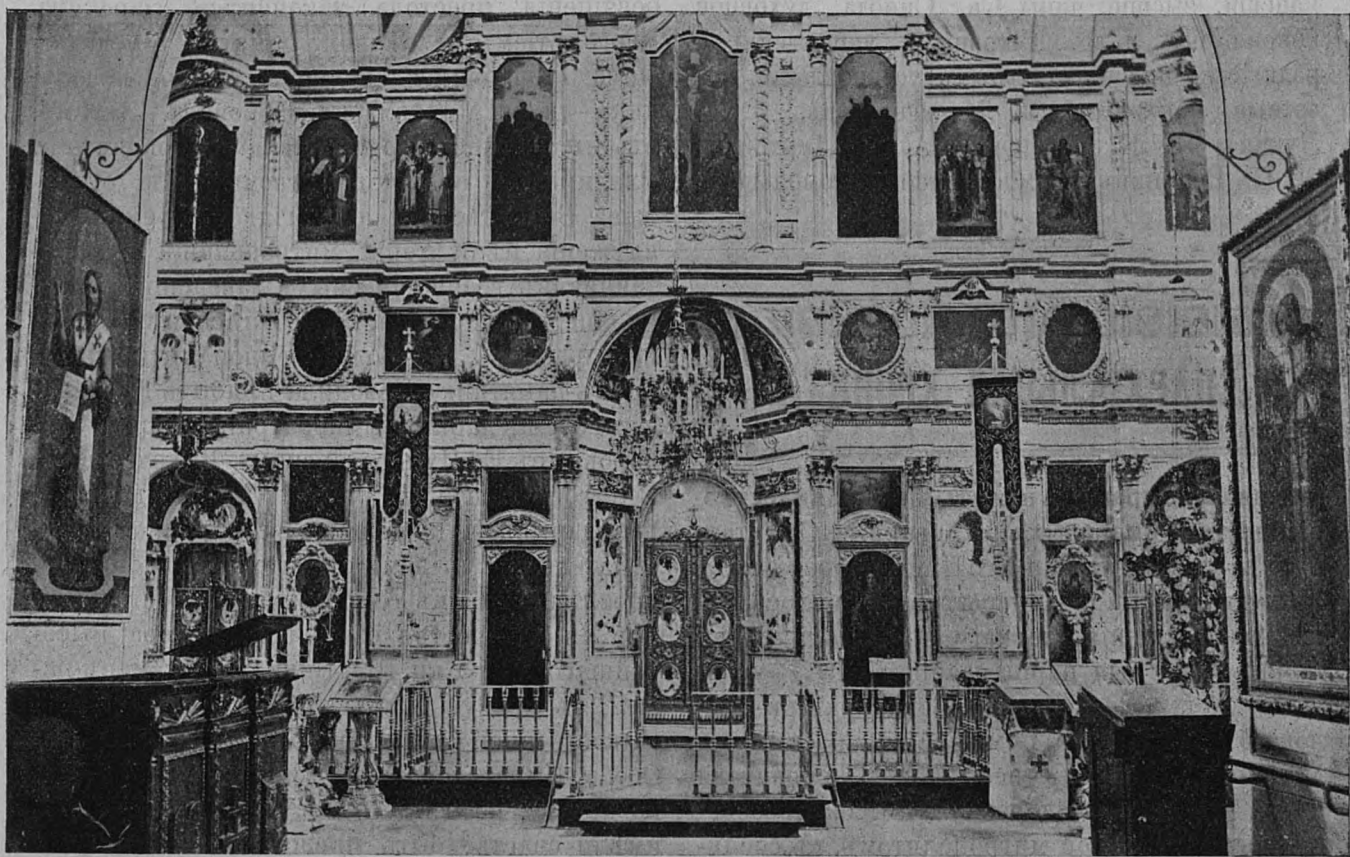
Иконостасъ церкви во имя св. Симеона Богопріимца и Анны Пророчицы на Симеоновской ул.