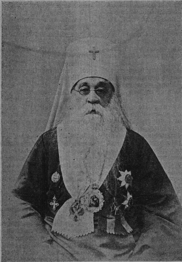
Флавіанъ Митрополитъ Кіевскій