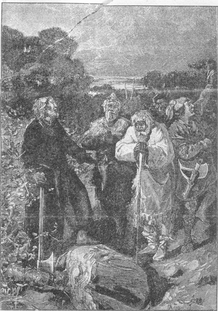
Проповѣдь св. Стефана Пермскаго зыряннамъ.

Въ теченіе 1908 года подписчики получаютъ: