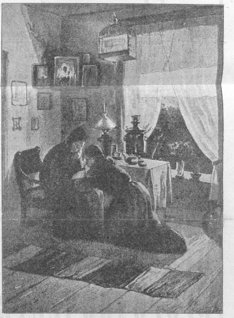
Духовное утѣшеніе страдальца.

При этомъ обращаемъ вниманіе читателей, что, нисколько не уступая по полнотѣ другимъ полнымъ собраніямъ Житій Святыхъ, стоящимъ въ розничной продажѣ отъ 12 до 15 р. и дорожее (какъ еще не законченное изданіе Моск. Синод. Типографіи),—наше изданіе, какъ приложение безъ дополнительной платы, является первымъ и единственнымъ общедоступнымъ для всякаго подписчика.