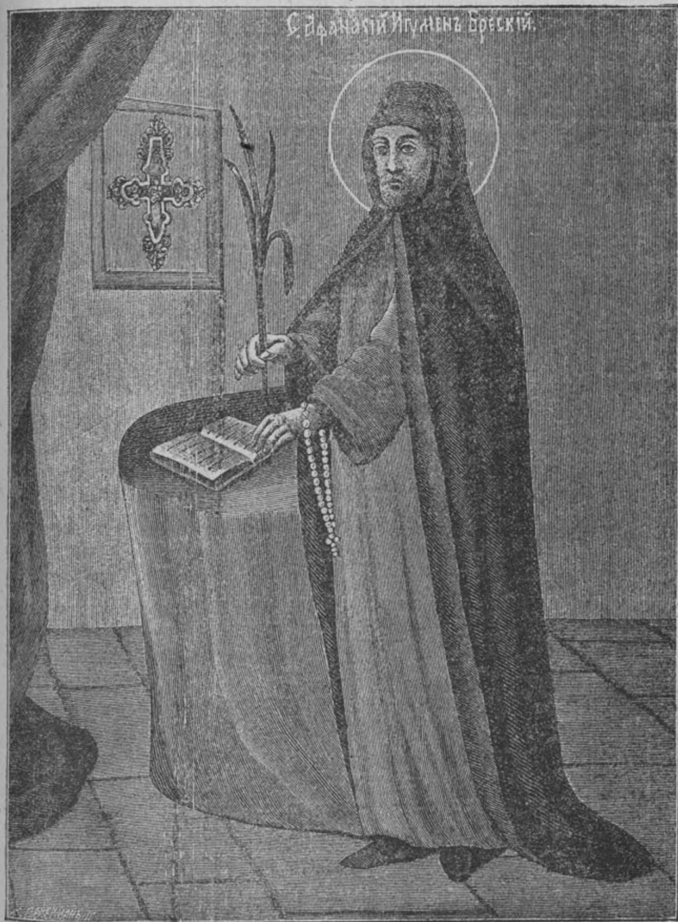
Свѣдѣнскій Игумънъ Брескій.

бѣднѣйшій, испросилъ у св. Аѳанасія прощенье, поклонился ему до земли, поцѣловалъ ноги и руки его—и тогда