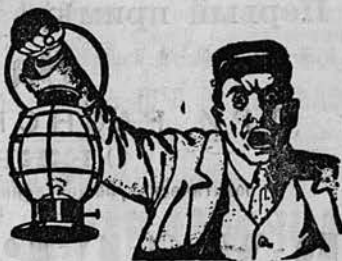
Тов. знак. утв. прав.

Зудъ и боль проходятъ почти моментально. Цѣна 1 руб. 50 коп. С. РОСТОВЪ, Казанская ул., № 26, С. Петербургъ. Имѣется въ аптекар. магазинахъ и аптекахъ. Въ продажѣ чудное мыло ЛАИН-РОСТОВЪ противъ недостатковъ кожи. Кусокъ 75 коп., 1/2 дюж. 4 руб. и гигиеническая пудра ЛАИН-РОСТОВЪ кор. 1 руб. Посылка налож. платежомъ по почтовому тарифу