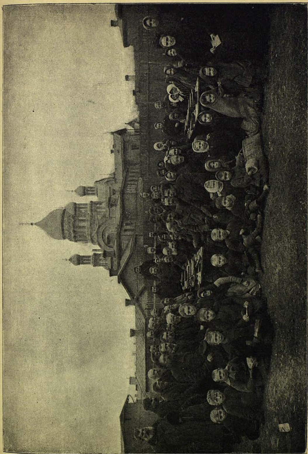
Трапеза бѣдняковъ въ Рижскомъ Троице-Сергіевомъ монастырѣ.