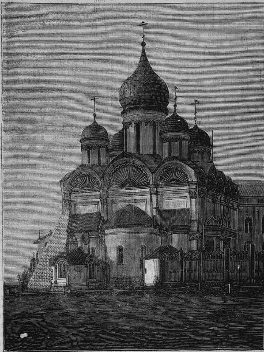
Наружный видъ Архангельскаго собора въ Москвѣ.

По наружному виду, храмъ хотя и имѣеть капитальныя стѣны отъ временъ великаго князя Іоанна Васильевича, но архитектура его отчасти измѣнена позднѣйшими пристройками и подпорами, не вполне соответствующими общей формѣ его преж-