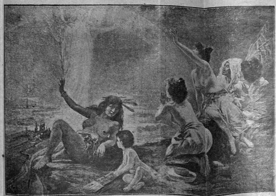
Народы привѣтствуютъ Новый годъ новаго столѣтія.