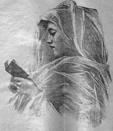
НА МОЛИТВѢ, рисунокъ Р. Бонча.