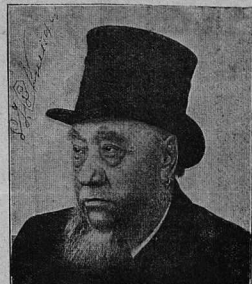
Президентъ Транскавказской республики Кравцовъ.

Въ кабинетѣ получаютъ до 500 НАЗВАНІЙ столичныхъ и провинціальныхъ русскихъ, польскихъ, славянскихъ, французскихъ, нѣмецкихъ, итальянскихъ, англійскихъ, японскихъ, греческихъ газетъ и журналовъ, спеціально научныя изданія, новыя романы, новосты, разказы, какъ русскіе, такъ и иностранные, а также модныя дамскіе журналы русскіе и иностранные.