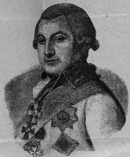
І. М. Де-Рибавъ. Основатель Одессы.

ВЪ ГОРОДѢ съ доставкой на домъ: 10 руб. въ годъ, 6 руб. полгода, 3 руб. 50 коп. три мѣсяца, 1 руб. 20 коп. въ мѣсяцъ. НА ГОРОДА съ ежедневной высылкою по почтѣ 12 руб. въ годъ, 7 руб. полгода, 3 руб. 80 коп. три мѣсяца, 1 руб. 30 коп. въ мѣсяцъ.