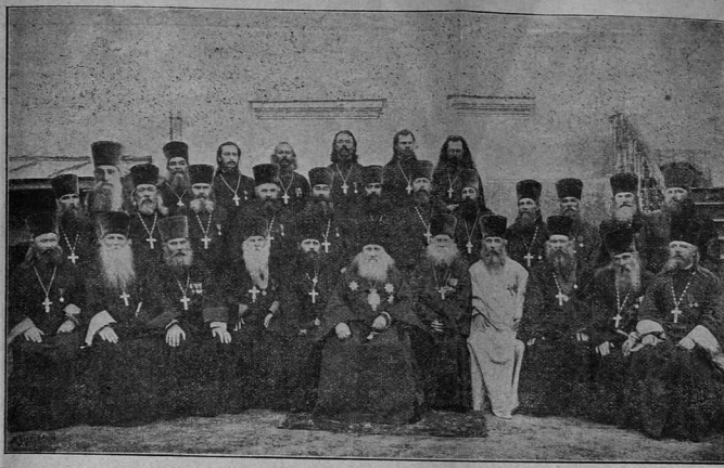
Сѣдѣльъ благотворныхъ херсонской епархіи въ г. Одессѣ въ 1900 г.