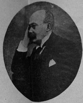
Петръ Дмитріевичъ Боборыкинъ.

Большая литературная, политическая и коммерческая газета