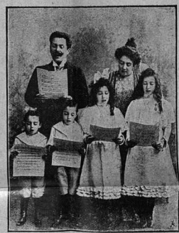
Семья Н. Н. Фигнера за столомъ пѣнія.