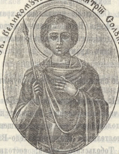
Св. великомученика Дмитрія Солдникіи

Подписка принимается въ Совѣтѣ Братства, въ г. Тобольскѣ.