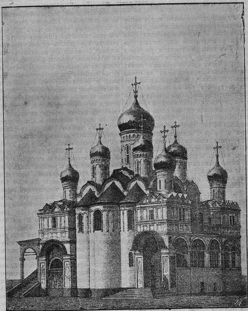
Благовѣщенскій соборъ въ Москвѣ.

щины на хорахъ. На хорахъ же или на паперти становился иногда и грозный царь Іоаннъ, когда въ минуту раскаянія восточнаго угла. Стѣны паперти росписаны характерными изображеніями ветхозавѣтныхъ пророковъ и древнихъ мудре-