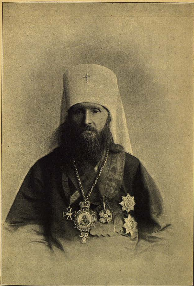
Высокопреосвященный Веогность, Митрополитъ Кіевскій и Галицкій.