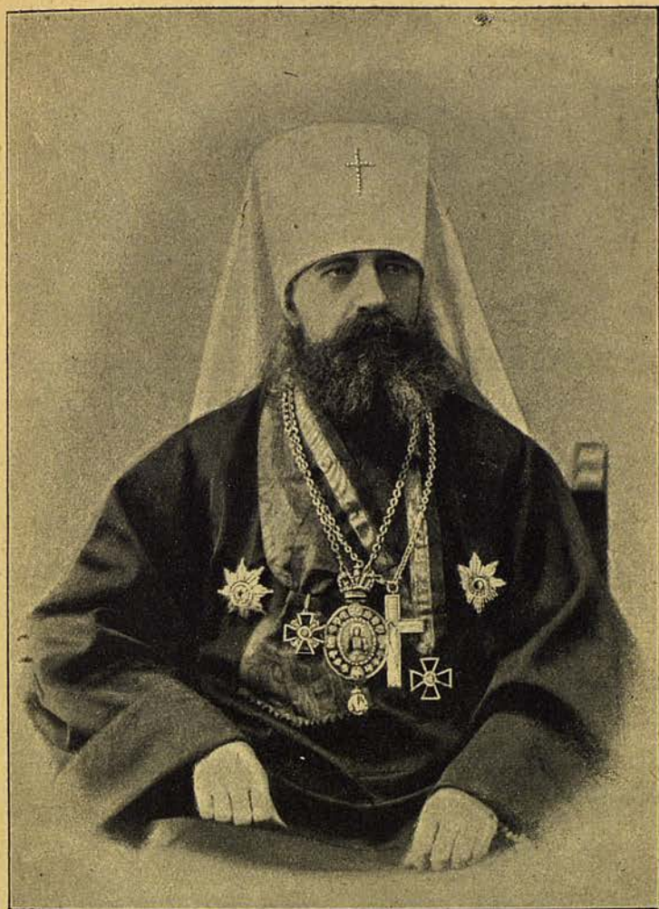
Высокопреосвященный Антоній, Митрополитъ С.-Петербургскій и Ладожскій.