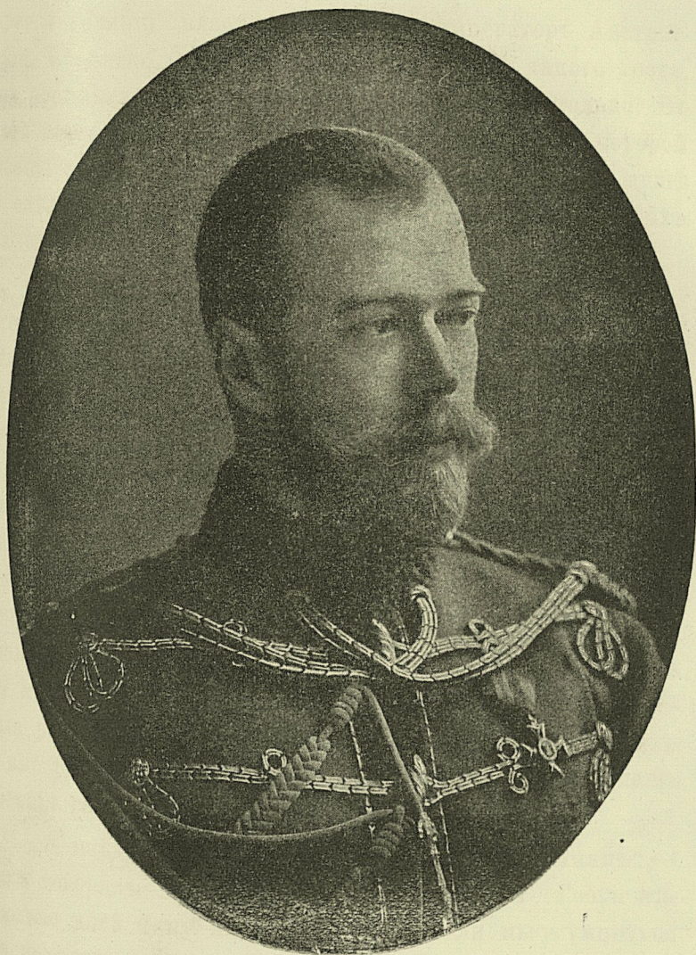
Его Императорское Величество ГОСУДАРЬ ИМПЕРАТОРЪ НИКОЛАЙ АЛЕКСАНДРОВИЧЪ.