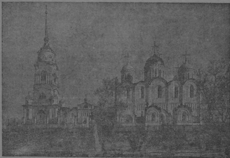
Скоропечатня И. Коиль. 1917 г.