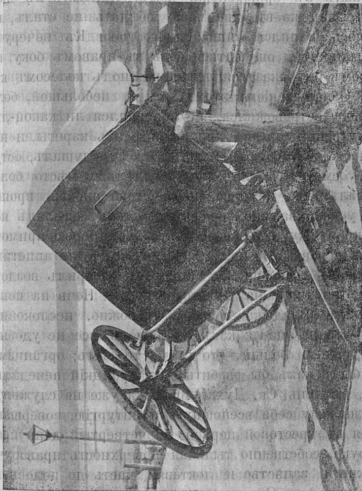
Видъ на мѣсто крушенія кареты съ сѣверозапада (съ верх. час. Тихвинскаго спуска).

ное поминовение. Затѣмъ припадокъ скоро прошелъ, и Владыка спокойно совершилъ дальнѣйшую часть литургіи. Приобщившись св. Христовыхъ тайнъ, Владыка совсѣмъ окрѣпъ, почему не уклонился служить и ве-