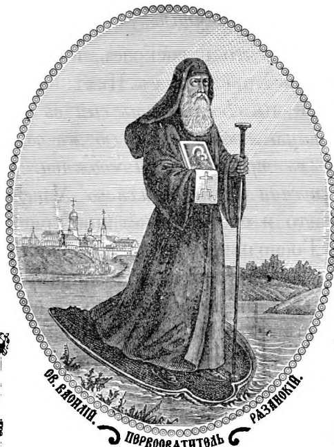
СВ. СЕВЕРІАНЪ ПЕРВОВЪЗРАТЦЪ РЯЗАНСКІЙ.

Редакція проситъ духовенство и учителей присылать статьи по всѣмъ вопросамъ программы.