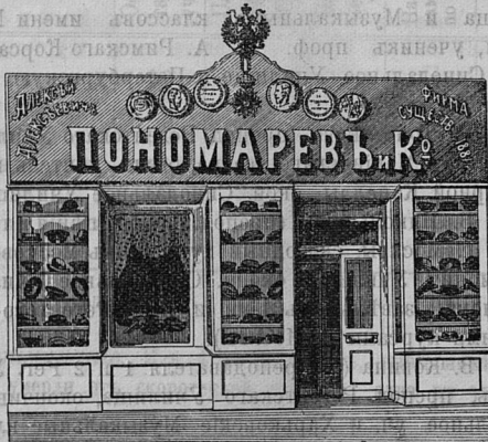
Саратовъ, Никольск. ул. д. Лютеранской церкви.

Принимаются ЗАКАЗЫ на Камилавки и Скуфьи.