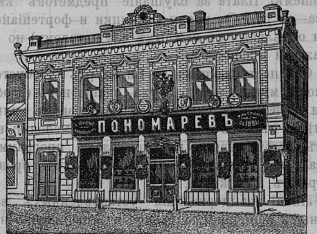
Самара, Дворянская ул. д. Лютеранской церкви.

Принимаются ЗАКАЗЫ на Камилавки и Скуфьи.