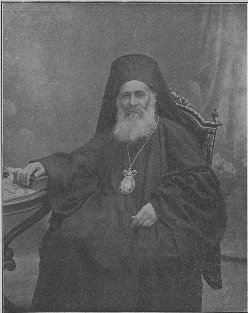
Вселенскій патріархъ Василій III.

ленія и преподавателей и учениковъ духовной семинаріи, присутствовало значительное число молящихся.