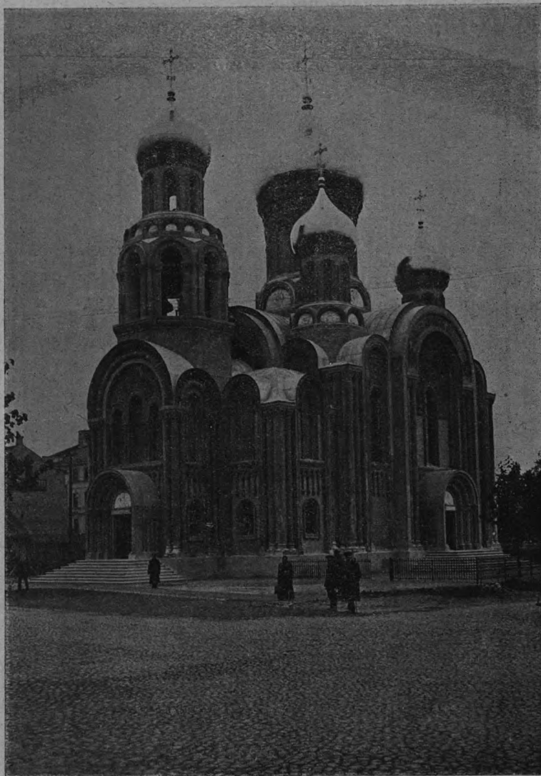
Внѣшній видъ храма-памятника.

данъ былъ наружный видъ собора, богато-убранный орнаментами, барельефами изъ бѣлаго цемента съ надписями изъ псалмовъ. Надъ западными дверями помѣщенъ барельефъ — благословляющій Спаситель, съ надписью: «Спаси Боже, люди Твоя и благослови достояніе Твое», надъ сѣвернымъ входомъ — Покровъ Пресвятыя Богородицы съ надписью: «Пресвятая Владычица Богородица, покрой насъ честнымъ Твоимъ омофоромъ» и надъ южнымъ входомъ — Преподобный Михаилъ Маленинъ и царь Константинъ съ надписью: «Вознесохъ избраннаго отъ людей моихъ». Въ кокошникахъ же у главокъ барельефныя изображенія