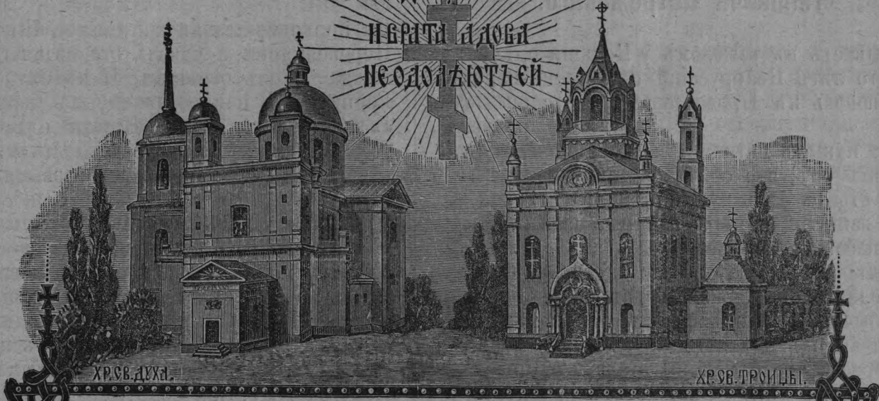
Хр. Св. Духа