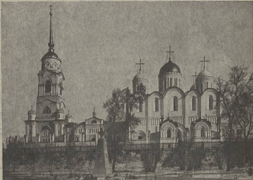
Губ. г. Владиміръ. Скоропечатня И. Коиль.