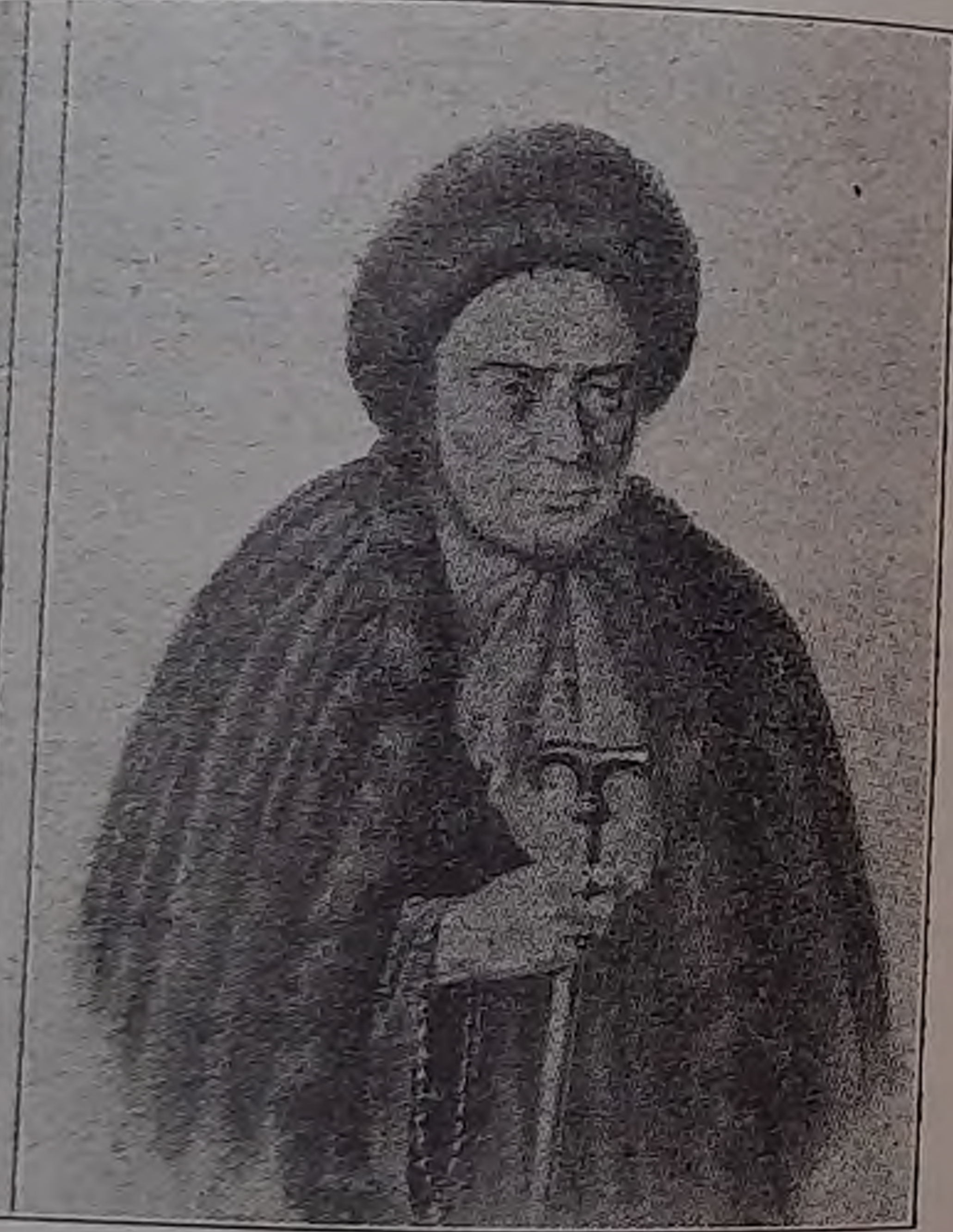
Боярыня Ксенія Іоанновна Романова. (Великая инокиня Марѳа).

повыхъ давно были извѣстенъ, всѣмъ еще были памятны страданія этого рода при Годуновѣ, всѣ знали великаго Ростовскаго святителя—митрополита Филарета Никитича Романова, который былъ отправленъ посломъ къ польскому королю и судьба котораго теперь, конечно, возбуждала сильное безпокойство. И къ 7-му февраля 1613 г. вопросъ объ избраніи въ цари боярина Михаила Ф. Романова, можно сказать, уже былъ рѣшенъ. Но такъ какъ еще не всѣ выборные были въ Москвѣ и нужно было узнать, какъ отнесутся къ это-