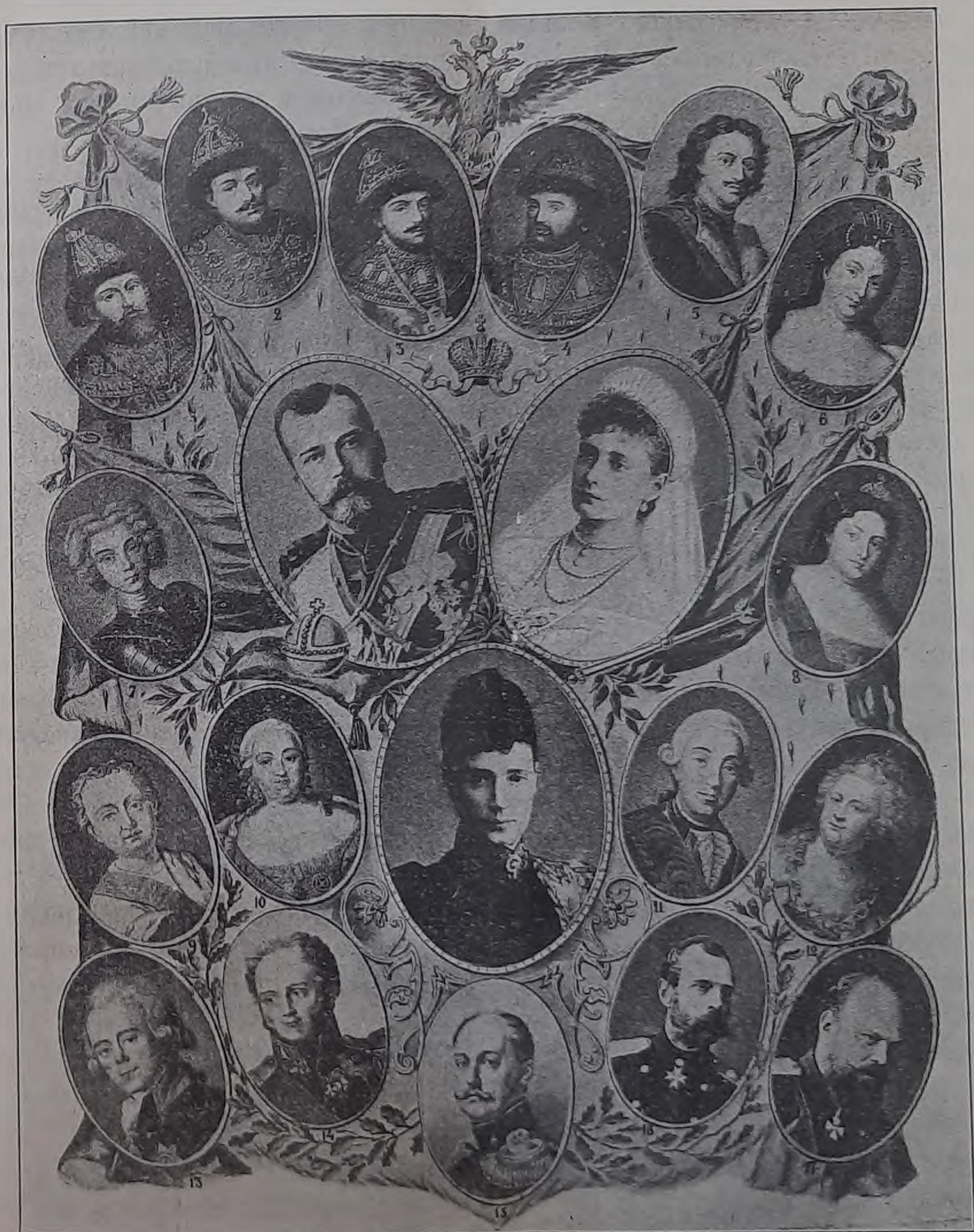
Домъ Романовыхъ. 1613—1913.