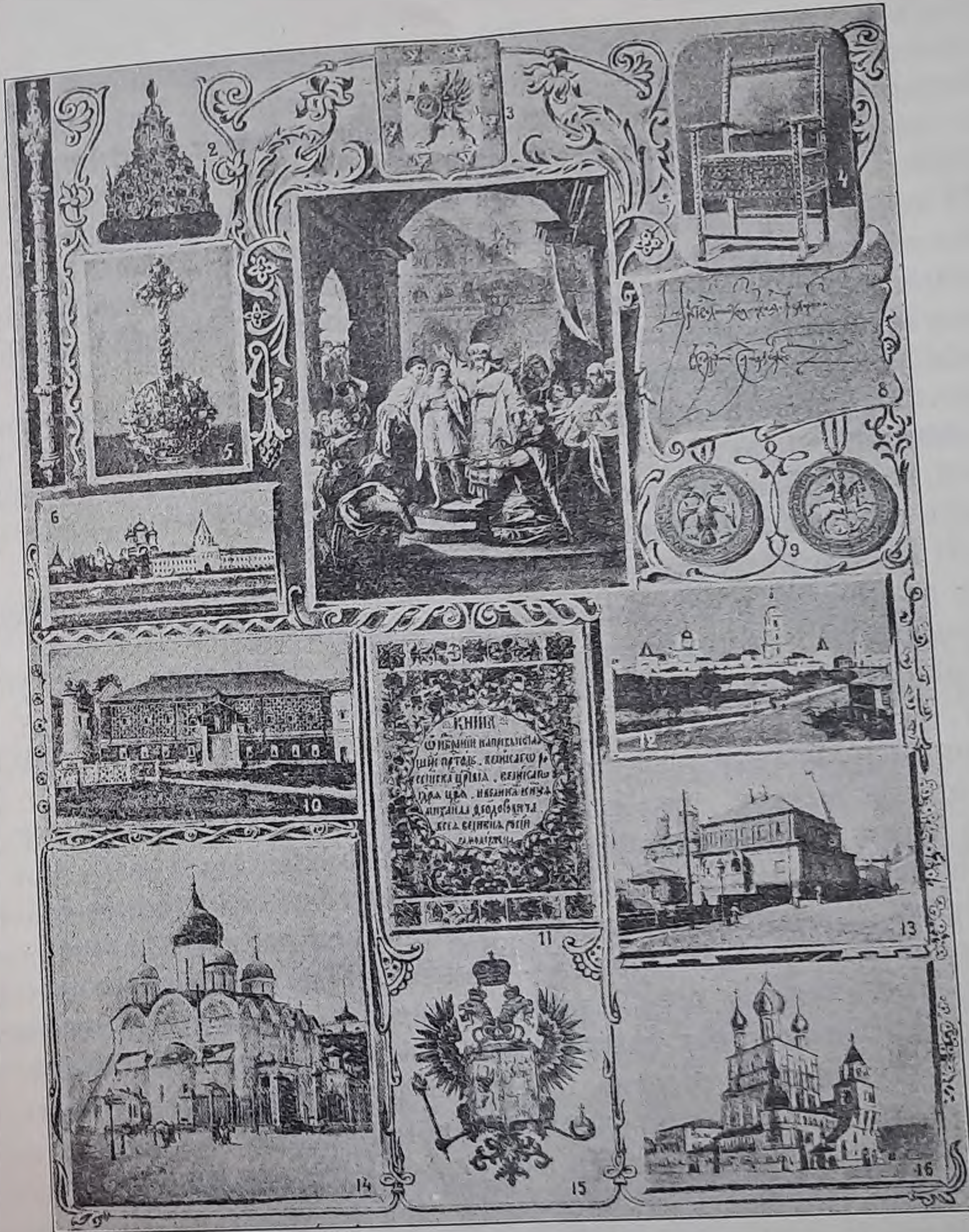
Скипетръ (1), царскій вѣнецъ (2), тронъ (4), держава (5) и печать (9) Михаила Феодоровича Романова. Гербъ рода (3). Избраніе на престолъ Михаила Феодоровича (7). Подпись его (8). Ипатьевскій монастырь (6) и Романовскія палаты съ немъ, гдѣ жилъ и принялъ царскую корону Михаилъ Феодоровичъ (10). Заглавный листъ рукописи XVII в. объ избраніи на царск. престолъ Михаила Феодоровича (11). Новоспасскій монастырь въ Москвѣ — усыпальница пердковъ Романовыхъ (12) и Архангельскій соборъ — усыпальница первыхъ царей Дома Романовыхъ (14). Домъ бояръ Романовыхъ на ул. Варваркѣ въ Москвѣ (13). Родовой гербъ Государя Императора (15). Проектъ храма въ Петербургѣ въ память 300-лѣтія царствованія Дома Романовыхъ (16).