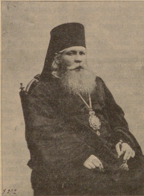
Превосв. Василій, еп. Старицкій. (Къ стр. 54).