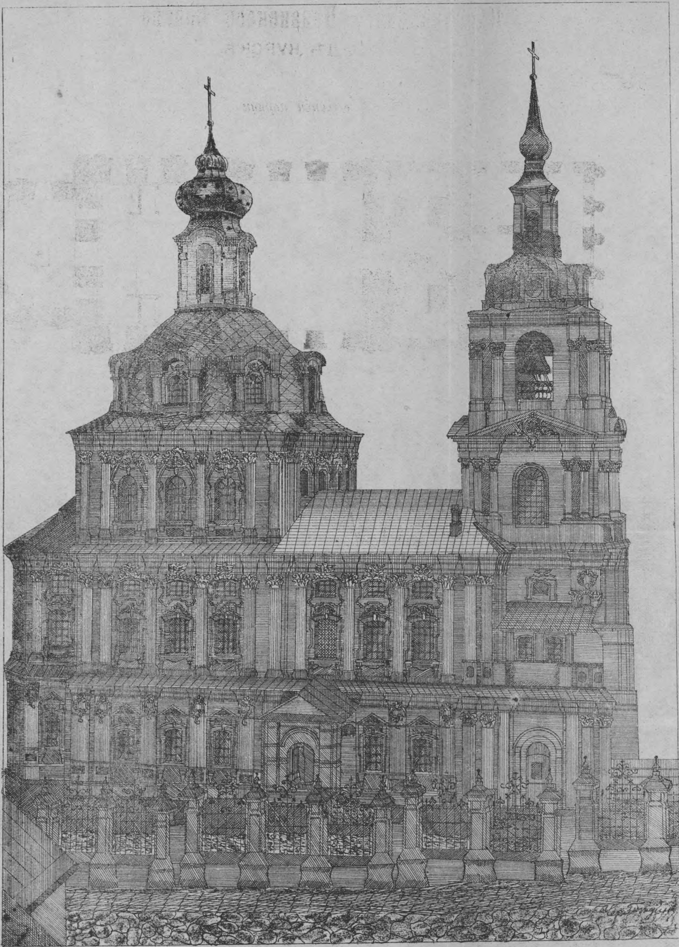
КУРСКИЙ КАТЕДРАЛЬНЫЙ КАЗАНСКО-БОГОРОДИЦКИЙ СОБОРЪ Архитектора Графа Растрелли.