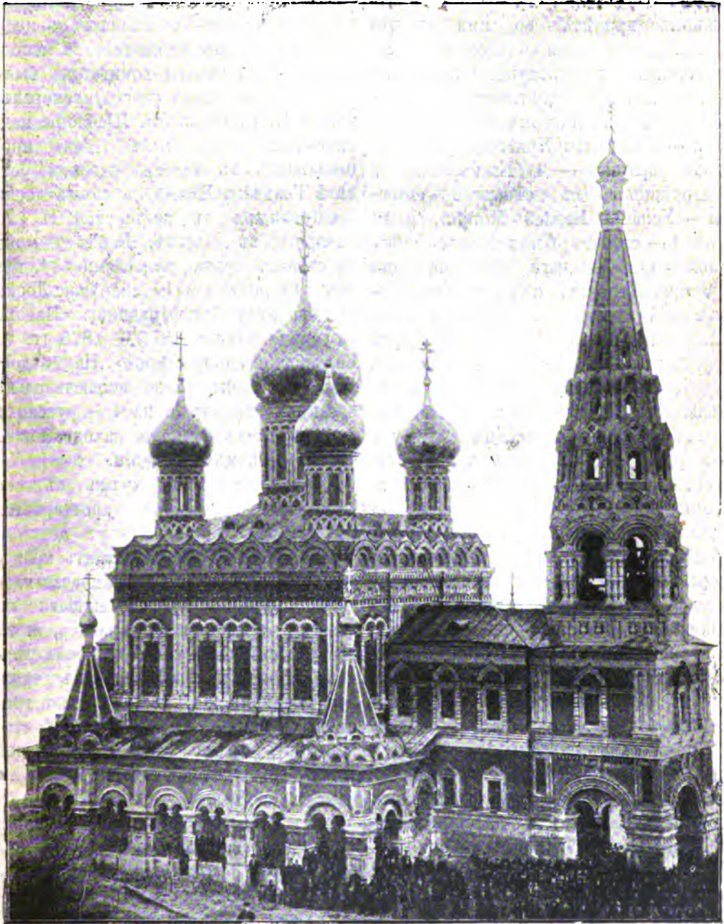
Храмъ-памятникъ у подножія Балканъ.