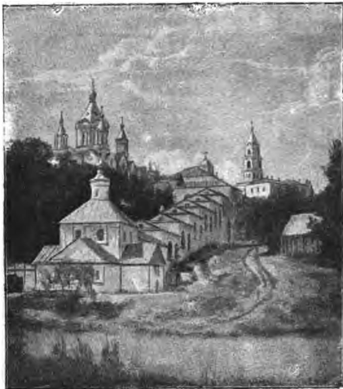
Видъ Коренной пустыни.

Съ южной стороны храма пристроена часовня, сооруженная, по преданію, надъ корнемъ или пнемъ того дерева,