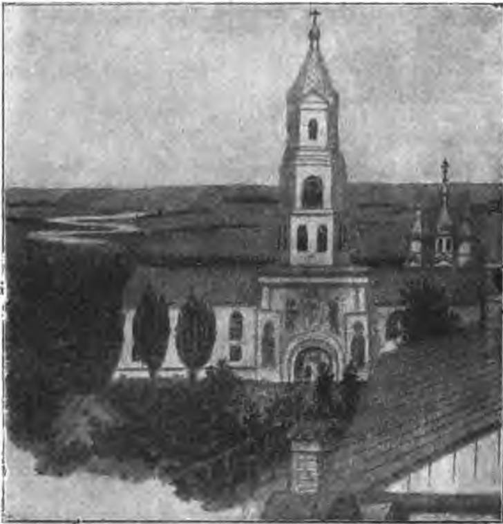
Святые ворота Коренной пустыни.

повъ; первые два верхніе уступа, начинаясь противъ южной стороны собора, имѣютъ направленіе отъ юга къ сѣверу; послѣдующіе, составляя съ ними прямой уголъ, идутъ внизъ къ церкви, по направленію отъ запада къ востоку. Всѣ они освѣщены большими итальянскими окнами, расположенными съ лѣвой стороны; противъ каждаго окна на правой сторонѣ написаны