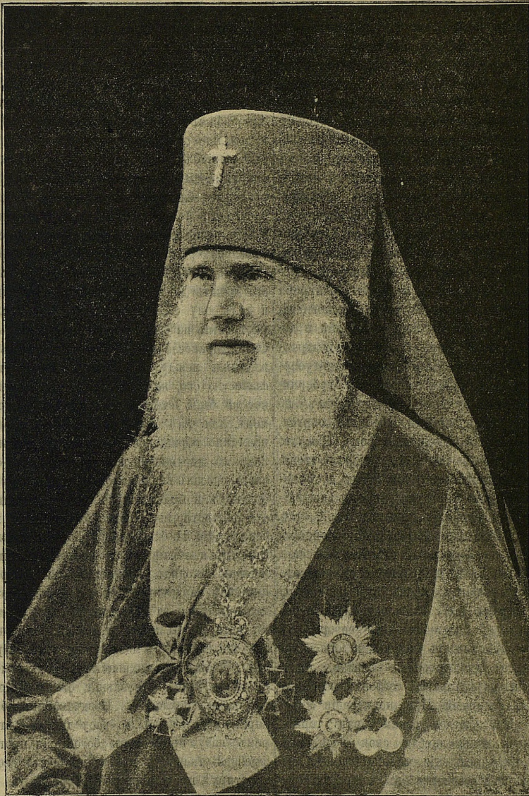
Пресвященный Амвросій, архієпископъ Харьковскій и Ахтырскій.