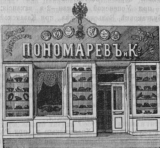
Саратовъ, Никольск. ул. д. Лютеранской церкви.

Принимаются ЗАКАЗЫ на Камилавки и Скуфы.