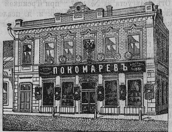
Самаръ, Дворянская ул. д. Лютеранской церкви.

Принимаются ЗАКАЗЫ на Камилавки и Скуфы.