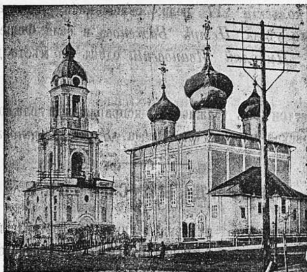
Тверской кафедральный соборъ.