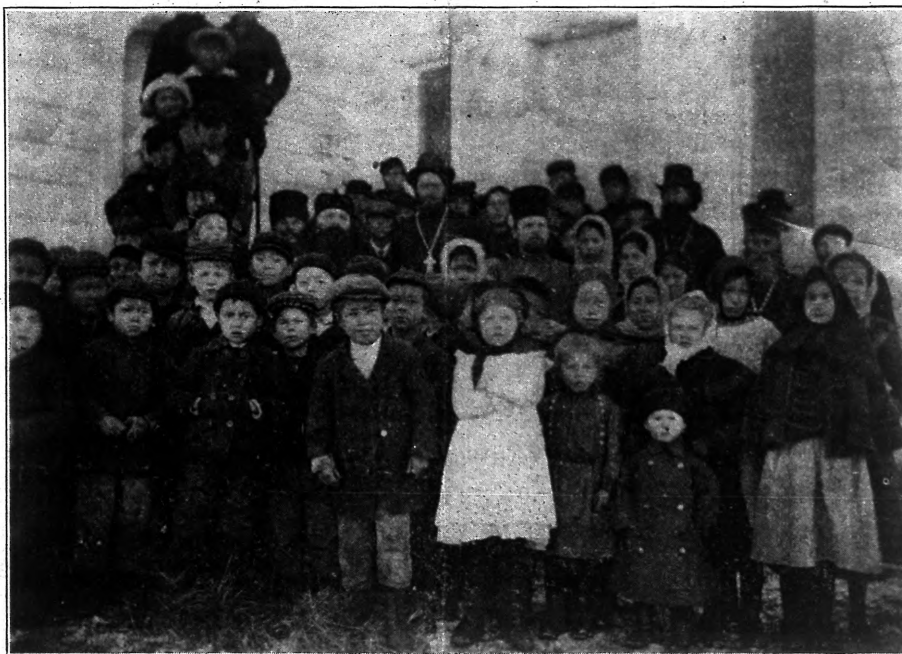
Русская школа въ томъ же селеніи, за тотъ же сезонъ.