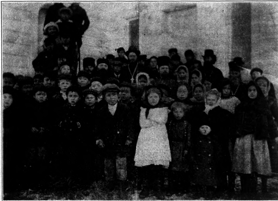
Русская школа въ томъ же селеніи, за тотъ же сезонъ.