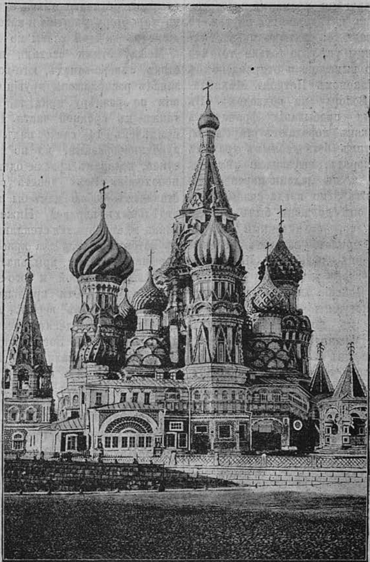
Псковскій святаго Василія Блаженнаго соборъ въ Москвѣ.

повелѣнію императрицы Елисаветы Петровны. Черезъ сорокъ лѣтъ императрица Екатерина II вновь возобновила соборъ со всѣми придѣлами, которыхъ въ то время считалось до двадцати. При этомъ возобновленіи въ наружномъ видѣ про-