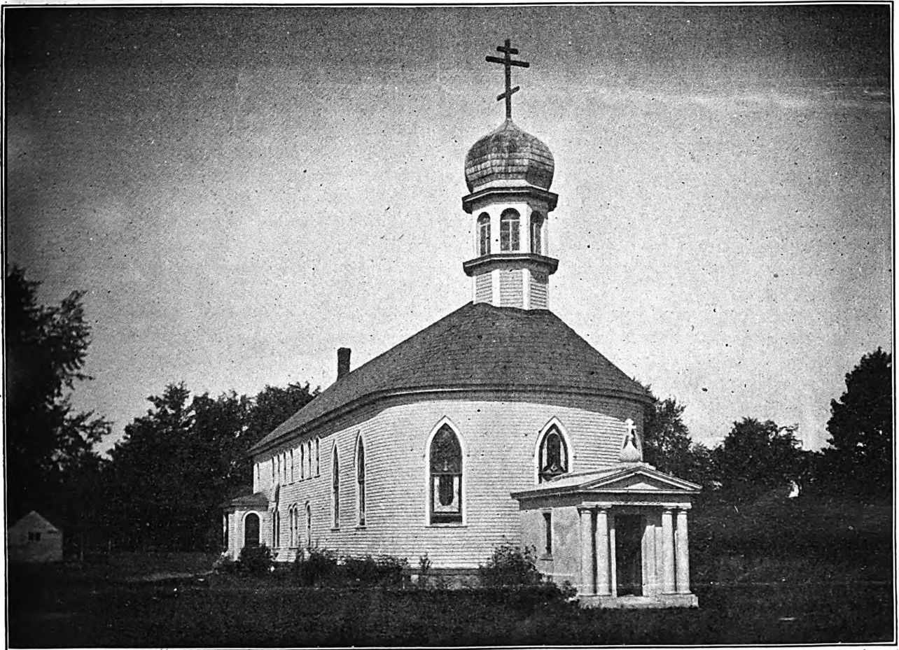
Видъ на главный корпусъ Св. Тихоновской обители съ сѣверной стороны

«Благословеніе Господне на васъ» заключилъ Владыка Митрополитъ свое слово. Народъ обливался слезами отъ умиленія. «Душу хотѣлъ бы я отдать за нашего мудраго и добраго Владыку» — говорили въ народѣ многіе... Впечатлѣніе отъ слова Высокопреосвященнѣйшаго Владыки на паломниковъ было