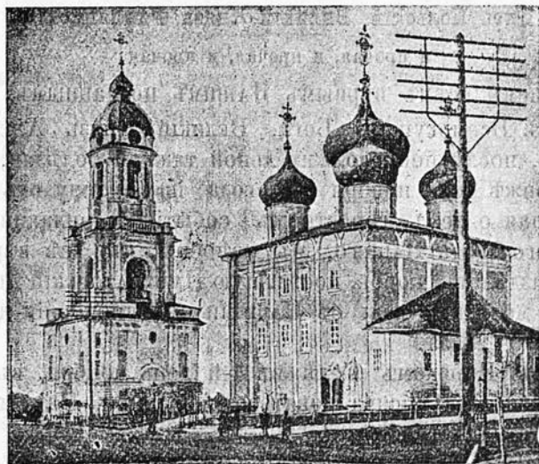
Тверской кафедральный соборъ.