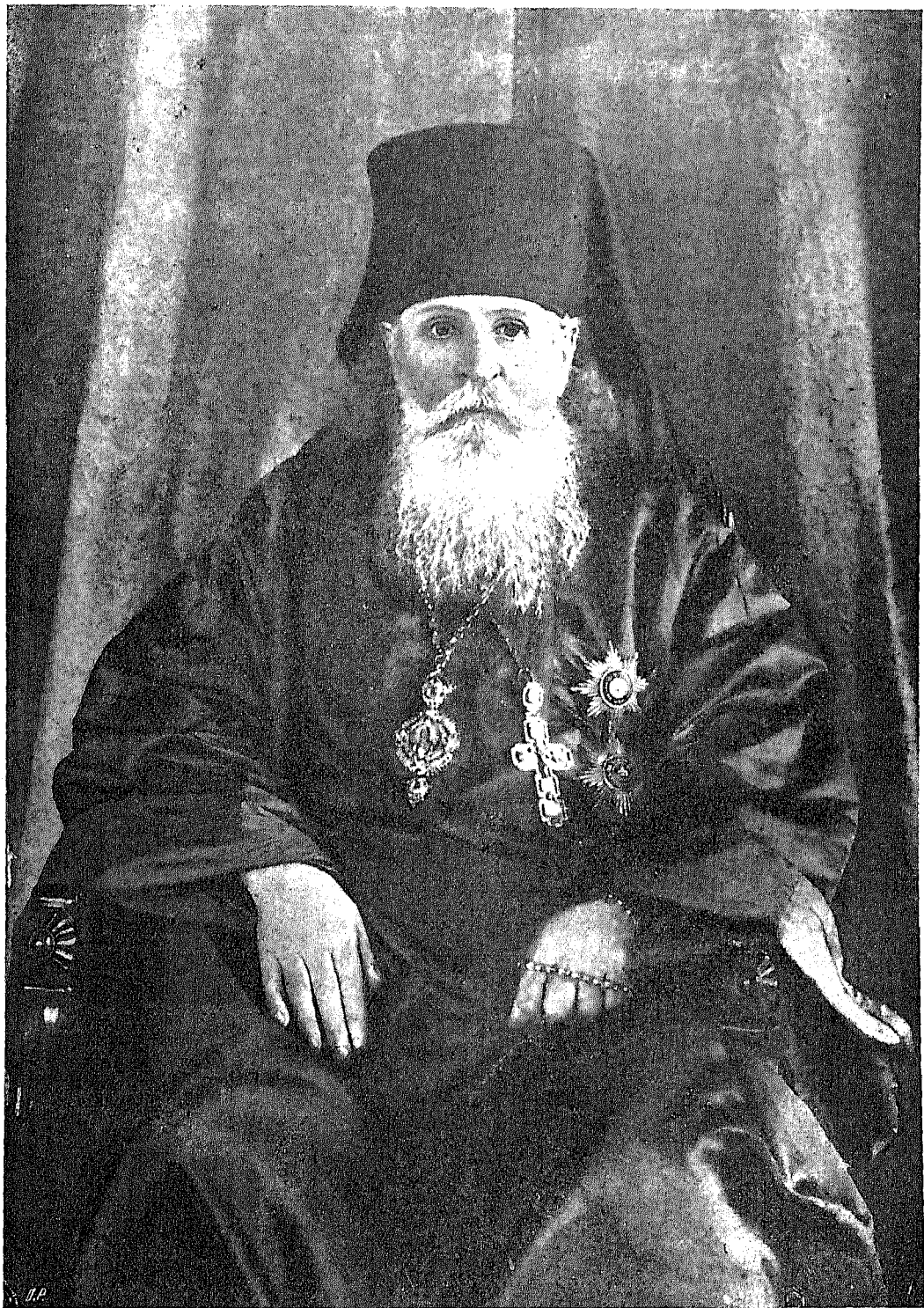
† Высокопреосвященнѣйшій Георгій, Архієпископъ Астраханскій и Енотаевскій.