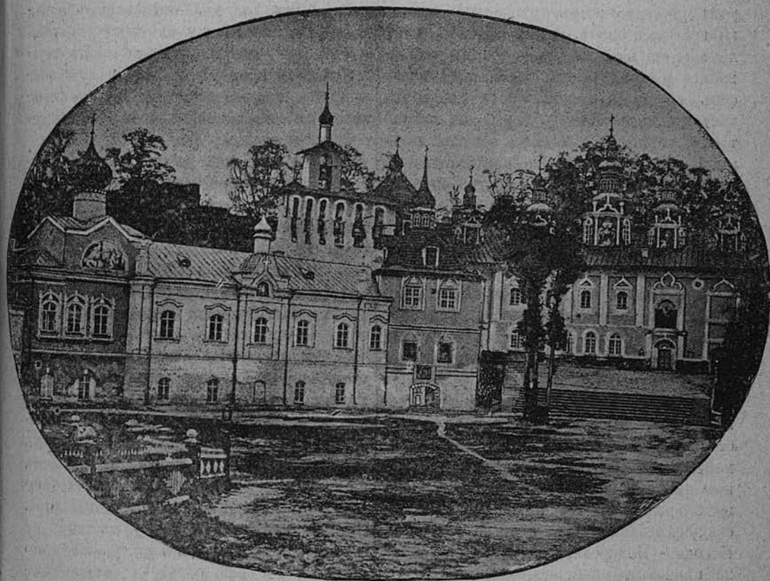
Внутренній видъ Псково-Печерскаго монастыря.

сопровожаемые тѣмъ же услужливымъ рисофорнымъ монахомъ. На Святой горѣ находится садъ съ плодовыми вишневыми и яблоневыми деревьями. Воздухъ здѣсь самый благоарастворенный. Жаворонки и другія птицы оглашаютъ вашъ слухъ своимъ веселымъ щебетаньемъ. У ногъ вашихъ сіяющія на солнцѣ золотыя главы Успенской перкви, какъ бы выходящія изъ земли. Позади ихъ возвышаются и зеленѣютъ старинныя, величествен-