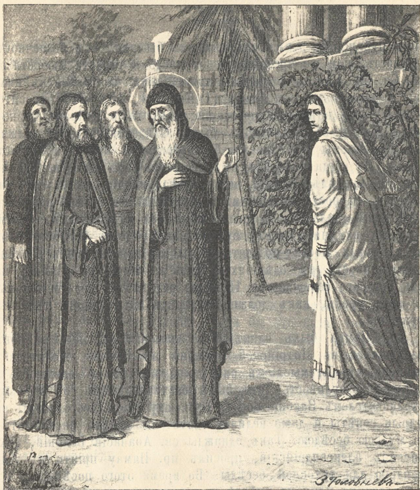
Преподобный Памва и разряженная женщина.