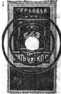
Видъ погашенной гербовой марки.

Штемпель монограм. каучук. 1 руб. 50 к. Такой-же металлическій 2 руб. 50 к.