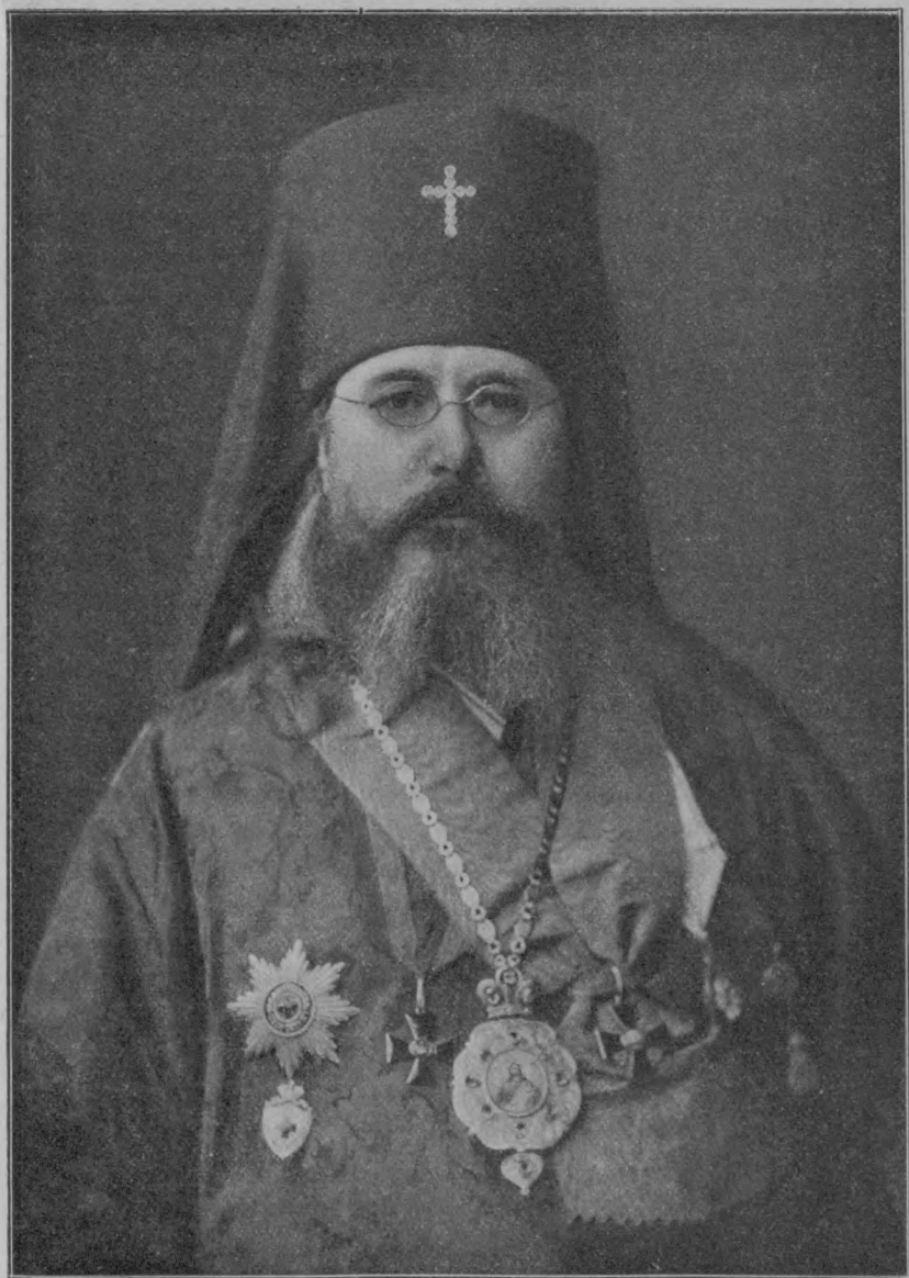
Архієпископъ Никонъ, Экзархъ Грузіи.